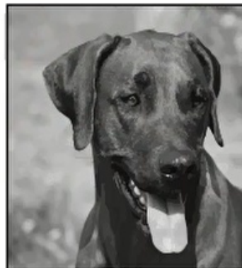
Daisy, Coonhound Beagle Mix